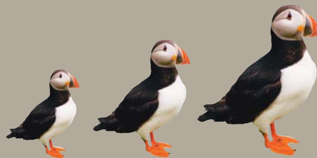
Ábyrgðarmaður: Andrés Sigurvinsson Hönnun, umbrot og myndskreytingar: Hvíta húsið